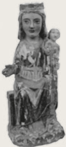
Abans de la restauració de la imatge l'any 1916