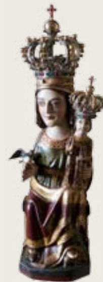
Mare de Déu restaurada

Els regidors de Berga, patrons i protectors del santuari, van sol·licitar i obtenir de l'autoritat eclesiàstica el permís per a la nova construcció. Les obres van començar el 16 de juliol de 1725, com